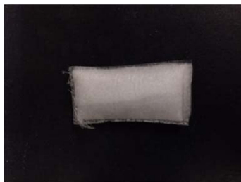
(シート：触媒生成前)