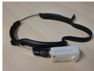
選手が装着する ウェアラブルセンサー