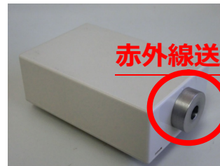
コースに設置する 赤外線通信機