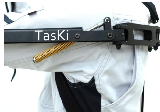
ばねを用いた機械式の自重補償