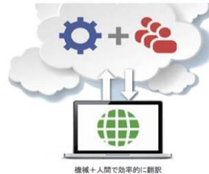
機械+人間で効率的に翻訳

ワールドジャンパーは、 「機械翻訳+人間翻訳のハイブリッド」で、 プロレベルの品質を維持しながら、 従来よりも大幅にコストを抑え、 手間と時間を短縮する 翻訳ソリューションです。