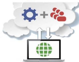
機械+人間で効率的に翻訳

ワールドジャンパーは、 「機械翻訳+人間翻訳のハイブリッド」で、 プロレベルの品質を維持しながら、 従来よりも大幅にコストを抑え、 手間と時間を短縮する 翻訳ソリューションです。