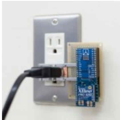
コンセントに装着した小型電力センサノード

このようなセンサネットワークは数多く提案されていますが、石橋研究室では、電極には非接触でプラグに貼り付けるだけで利用でき、電磁誘導を使って電力を収集し、バッテリーレスで自律的に動作することができる技術を研究しています。